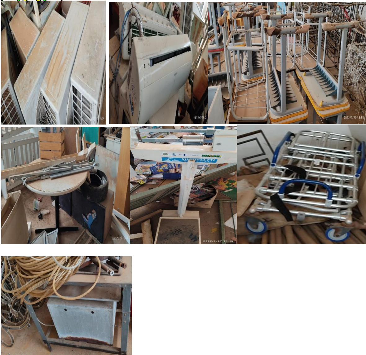
Tabela com o aproximado dos bens de sucata: De todas as Secretaria Municipais