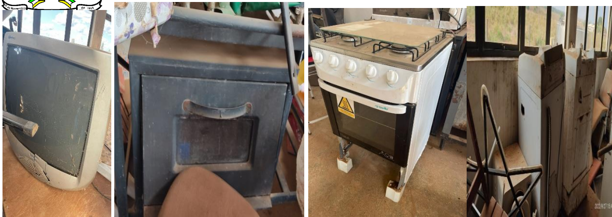
Tabela com o aproximada dos bens sucata elétrico domésticos Secretaria Municipal de Assistência Social