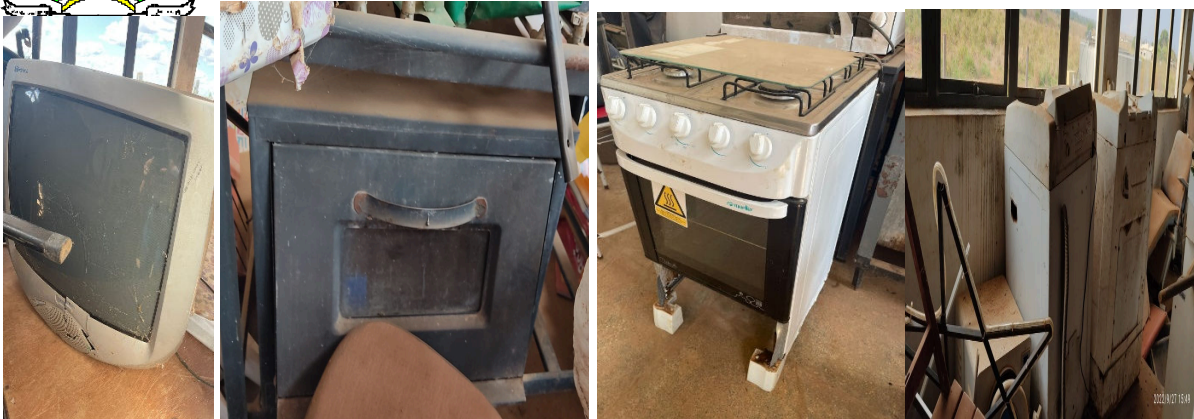
Tabela com o aproximada dos bens sucata elétrica domésticos Secretaria Municipal de Assistência Social