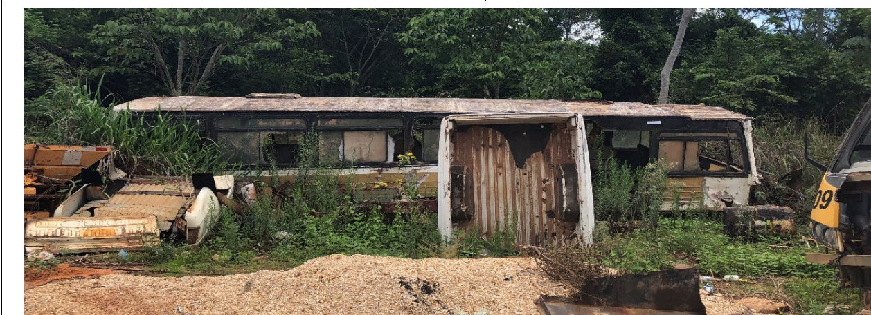
Veículo Ônibus Placa AFX 4037 /1970